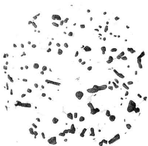
图 3 轻微过烧组织