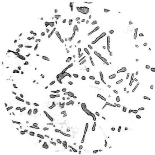
图 1 正常组织