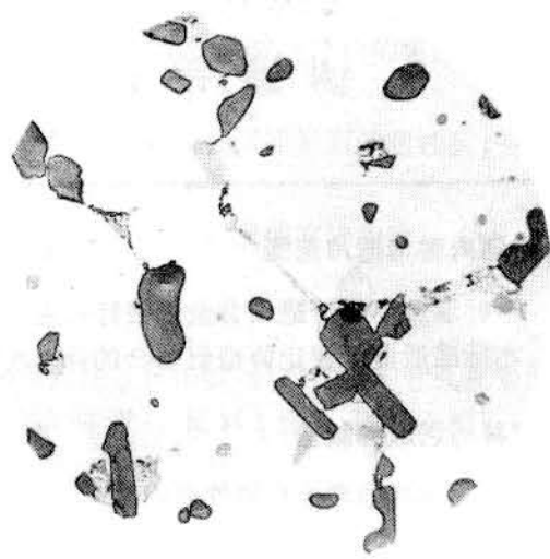
图 4 过烧组织