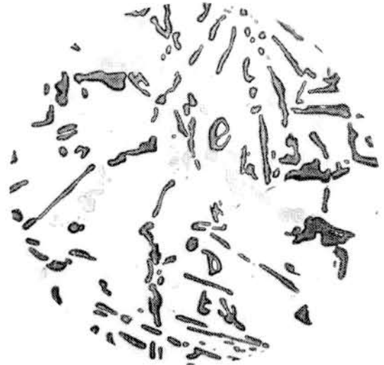
图 2 过热组织