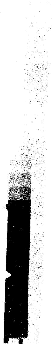
图 1 超过安全灯安全照明时间的试片